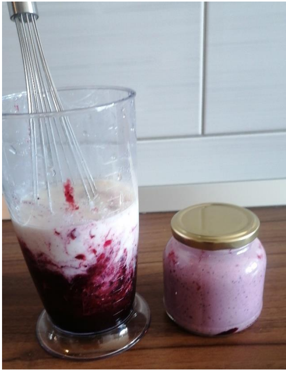
Tia Pograjc, 6.r (domači jogurt)