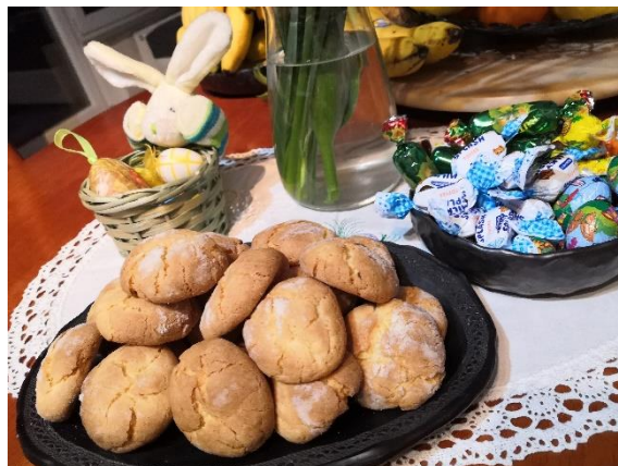
Nimma Lote, 5.r (razpokančki)