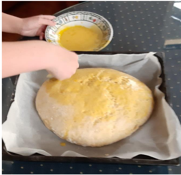
Gaj Krašovec, 6.r (kruh)