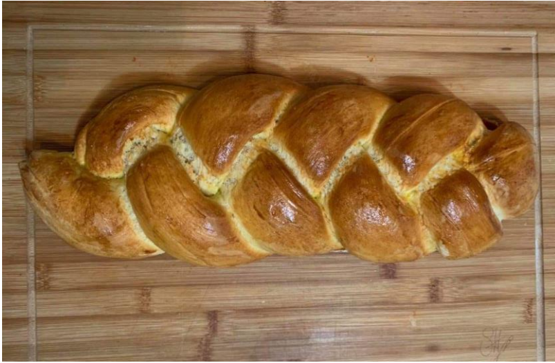
Sergej Longar, 8.r (mlečni kruh)