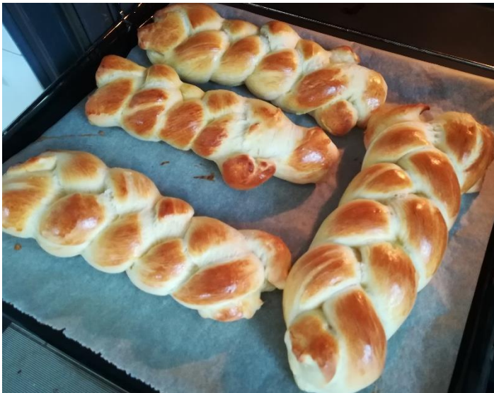
Alja Fink, 6.r (pletenica)