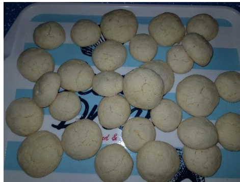
Aljaž Klobčar, 5.r (razpokančki)