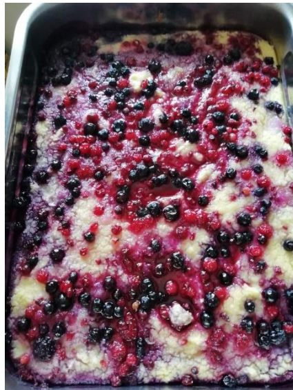
Tanja Nose, 6.r (narastek s pšeničnim zdrobom in gozdnimi sadeži)