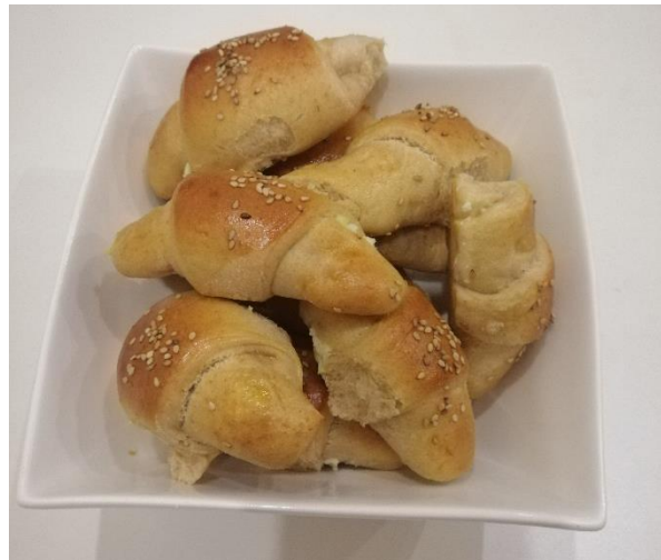
Tian Timotej Zupančič, 6.r (kifeljčki)