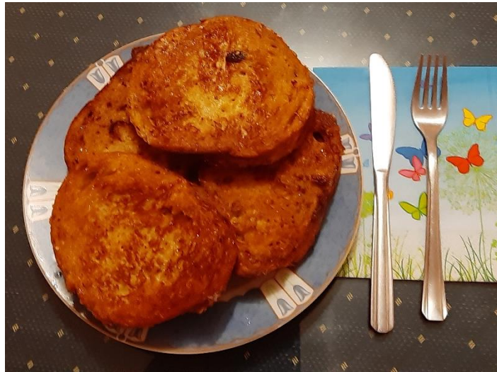
Gaj Krašovec, 6.r (kruhove šnite)