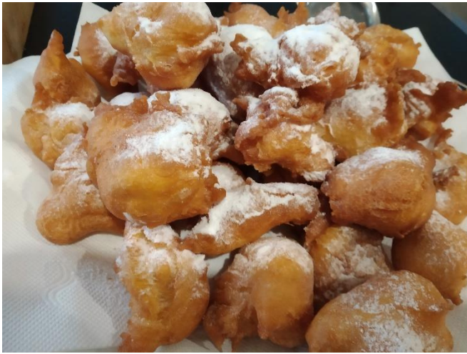
Žiga Šporar, 6.r (miške)