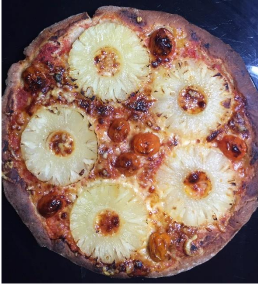
Julija Gregorčič, 8.r (anasosova pica)