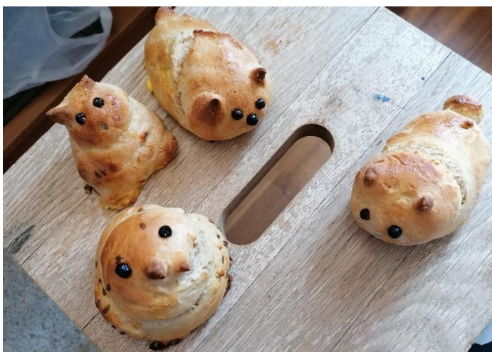
Ines Miklavčič, 6.r (velikonočni zajčki in piščanček)