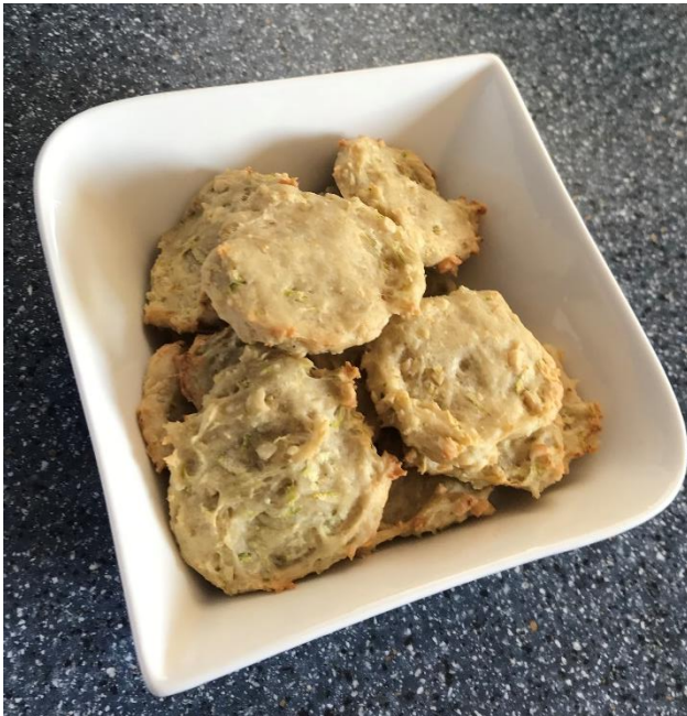
Neja Besednjak, 8.r (mehki bučkini piškoti)