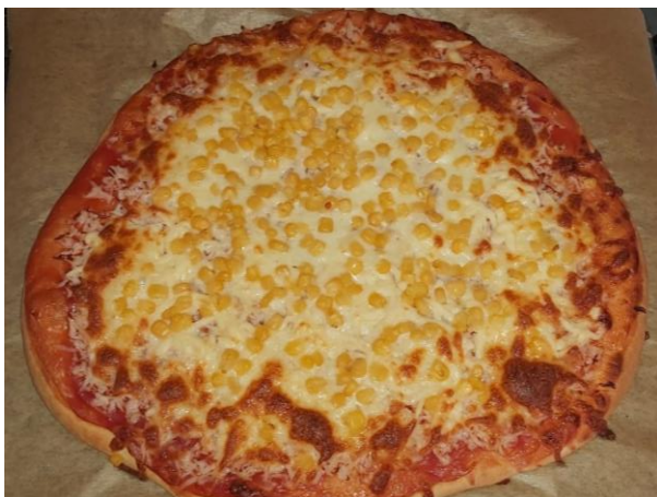
Neja Starič, 6.r (pica)